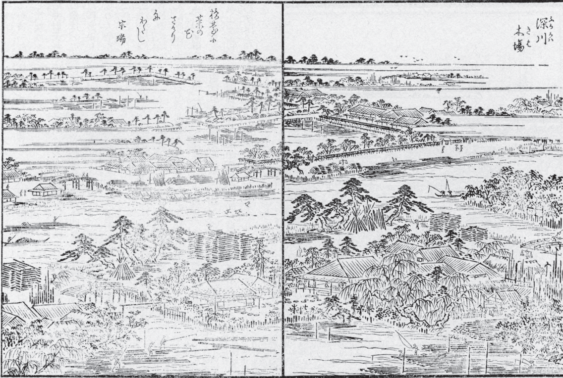
■ 5 雪旦：江戸名所図会 州崎弁財天社：押し寄せる波、左下、州崎を通り、弁天社にぞくぞく参詣客。左上、木場、平野川、江島橋を渡って弁天社に。茶店や料理屋があり、江戸庶民憩いの場所。