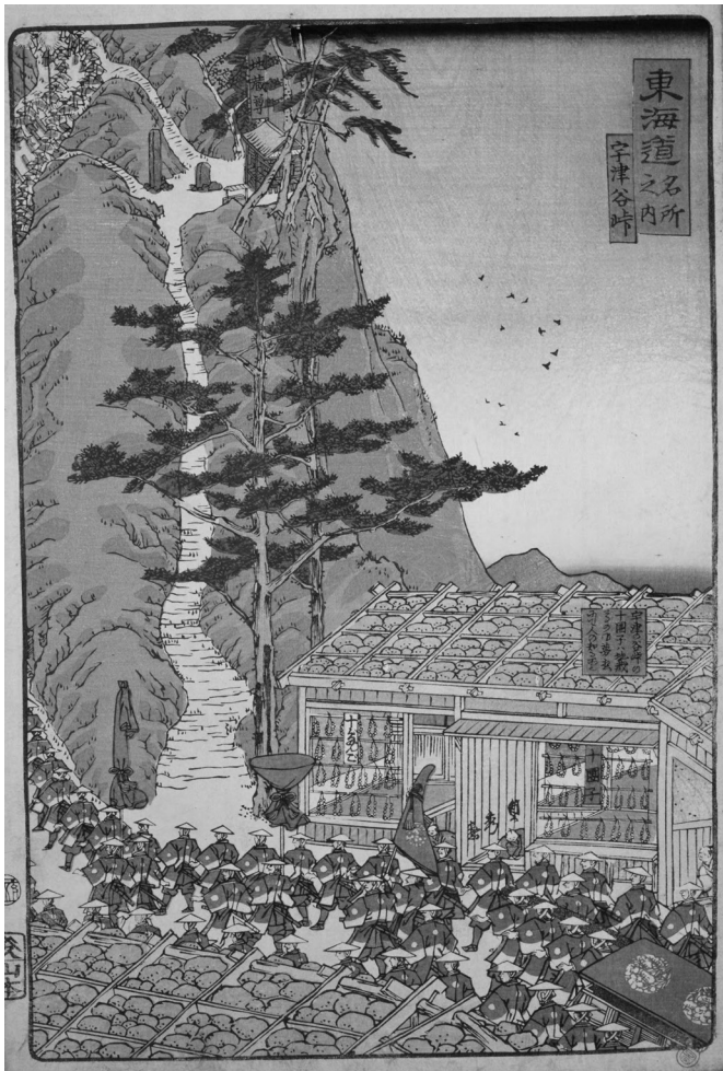
■ 5 : 東海道名所風景：貞秀の「宇津谷峠」大名行列が急峻な坂道を登っていく光景